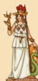
MINERVA Dios de la Sabiduría