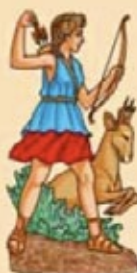
DIANA Diosa de la Caza