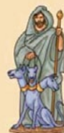
PLUTÓN Dios del Infierno