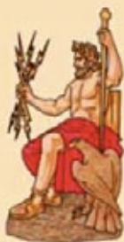
JUPITER Rey de los Dioses

Con la conquista de Grecia, Roma adoptó la mitología politeísta griega, pero cambiando el nombre de alguno de los Dioses.