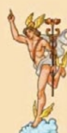
MERCURIO Dios del Comercio