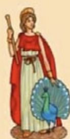
JUNO Diosa de la Familia